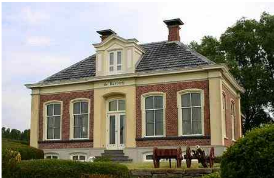
De batterij, Zoutkamp